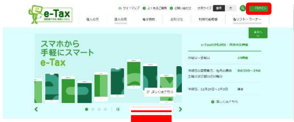
国税電子申告・納税システム (e-Tax)

パソコンでe-Taxホームページ開き、画面上部の「ログイン」から「受付システム」にログインし、「メールアドレスの登録等、お知らせメールの宛名登録」を選択後、登録。